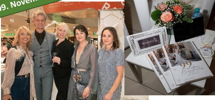
© Elisabeth Lechner & Yasemin Gezzin